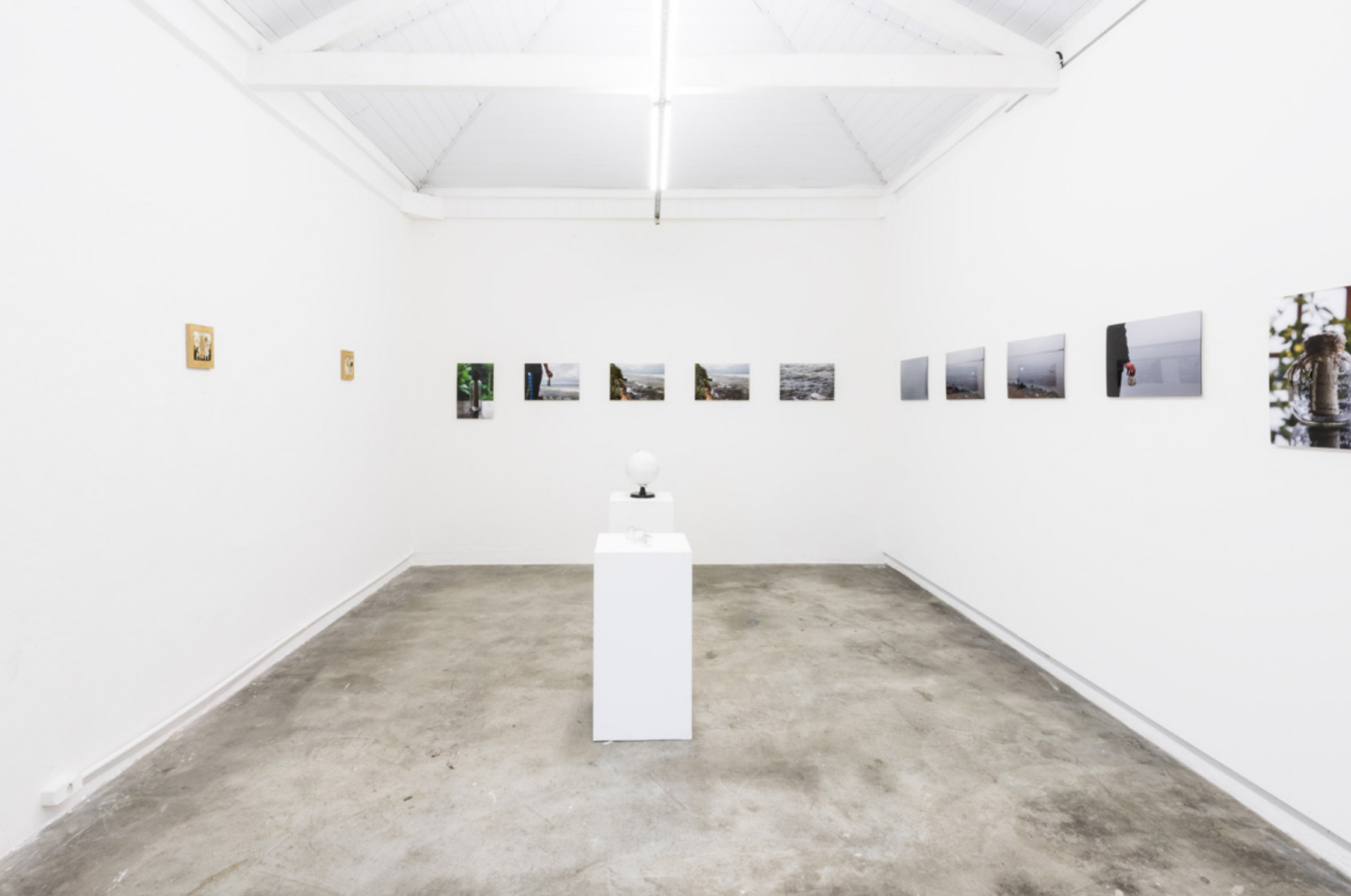
TAKAFUMI KIJIMA, Holy , 2016, vista da instalação | Holy , 2016, installation view